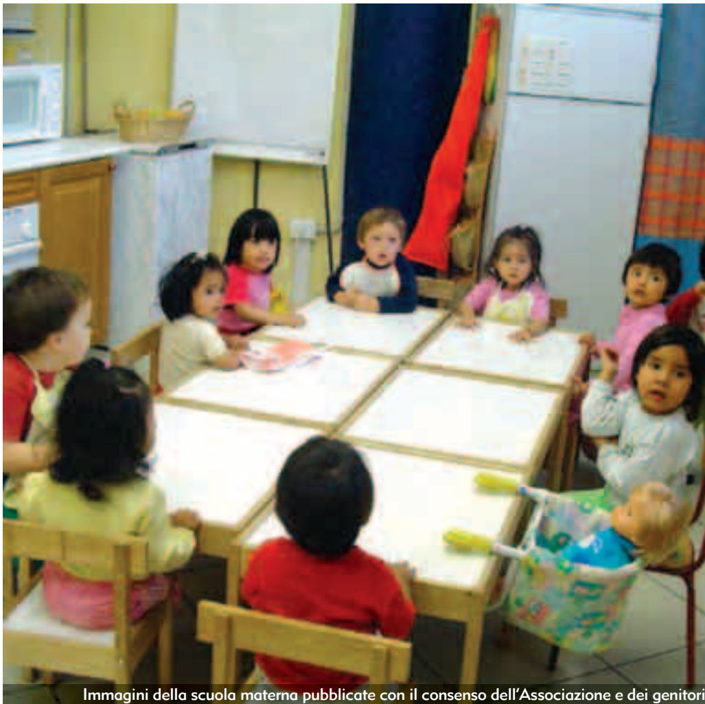
Immagini della scuola materna pubblicate con il consenso dell'Associazione e dei genitori

Punto critico è trovare volontari disponibili per dare visibilità all'Associazione, il cui interesse è relazionarsi con altri gruppi territoriali per promuovere intercultura e integrazione.