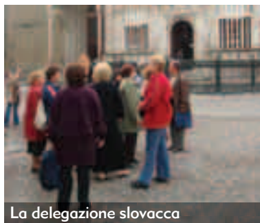
La delegazione slovacca

Una delegazione di volontari Slovacchi nella nostra città